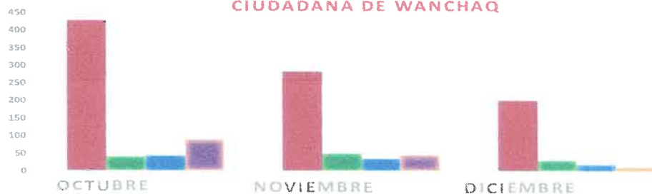
CUADRO DE INCIDENCIAS ATENDIDAS POR SEGURIDAD CIUDADANA DE WANCHAQ