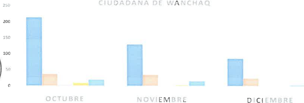
CUADRO DE INCIDENCIAS ATENDIDAS POR SEGURIDAD CIUDADANA DE WANCHAQ